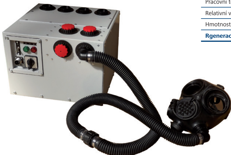
Filtr FMP 15